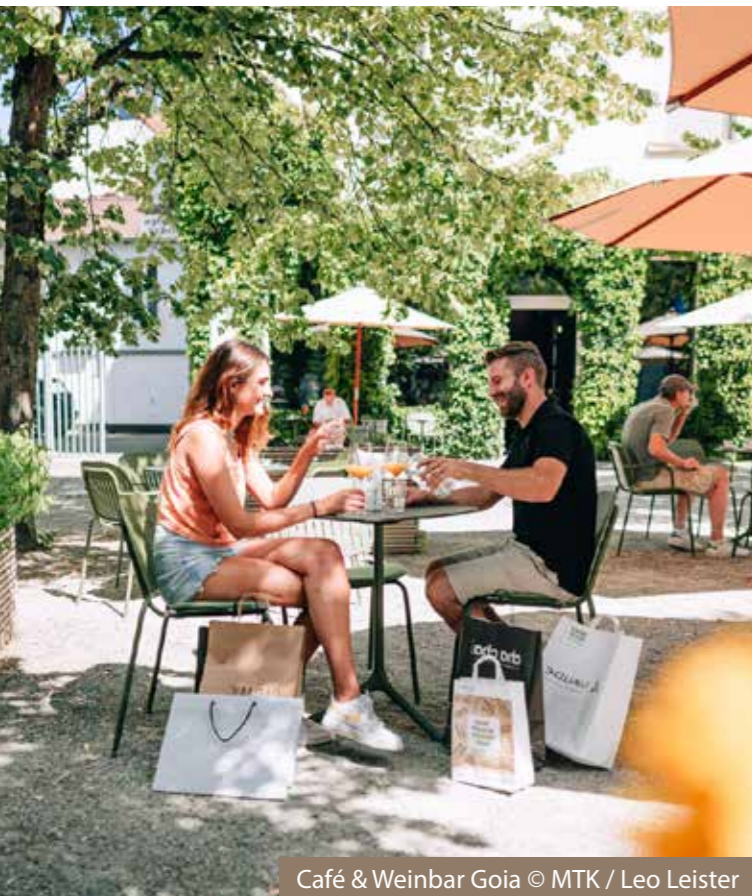
Café & Weinbar Goia