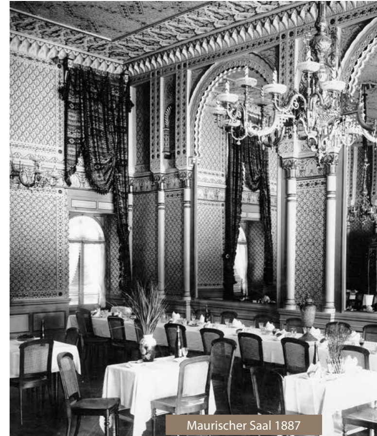
Maurischer Saal 1887

Der „Maurische Saal“, mit seinen orientalischen Dekorationsformen, der zu den herausragenden Hotelinterieurs des 19. Jahrhunderts („Belle Epoque“) am Bodensee zählt, ist eine Spielart des Historismus und steht für exotisches Fernweh und kosmopolitisches Bildungsideal von Adel und Bürgertum des 19. Jahrhunderts.