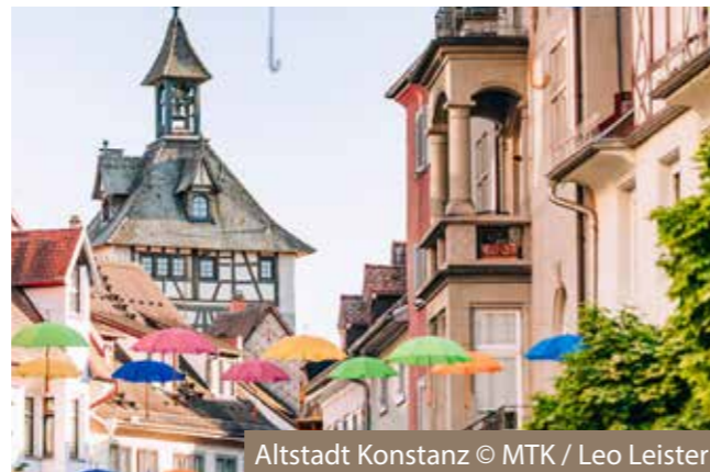
Altstadt Konstanz