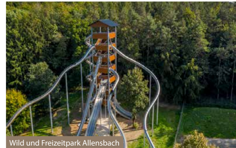
Wild und Freizeitpark Allensbach