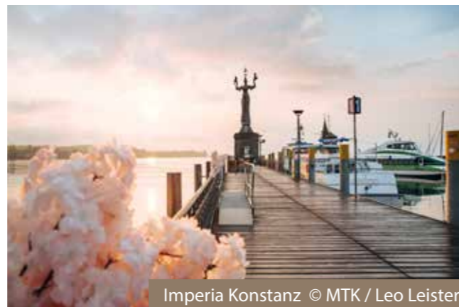
Imperia Konstanz