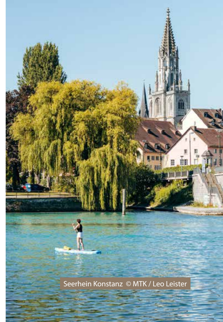
Seerhein Konstanz

Schlendern Sie durch die Einkaufsstraßen und entdecken Sie eine Vielzahl an verschiedenen Boutiquen oder besuchen Sie das große Lago Shoppingcenter, nur 3 Gehminuten vom Hotel entfernt.