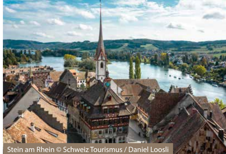
Stein am Rhein